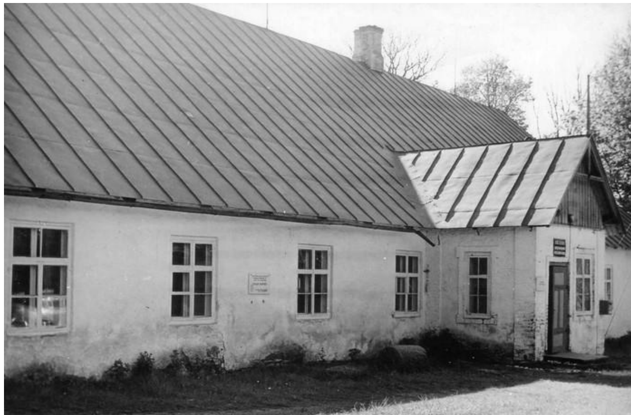
Hiiumaa Muuseumi hoone Kassaris 1979. aastal. HKM Fp 655:8 F1379