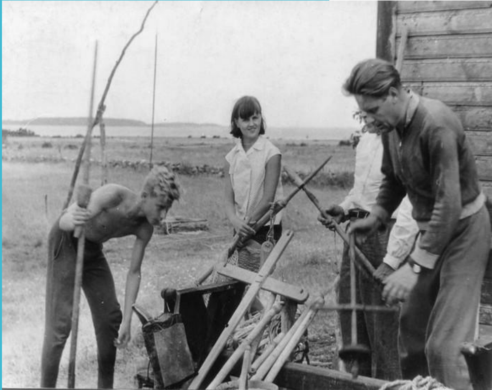
HKM Fp 572 F 519 Vanavara kogumisretk Hanikatsi laiule augustis 1967. aastal.